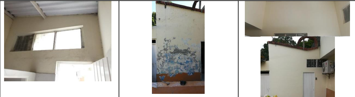
DESMONTE DE CUBIERTA EN TEJA ASBESTO CEMENTO - SUMINISTRO E INSTALACION TEJA ETERNIT ENTRAMADO SIN COLOR